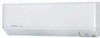
SRK25, 35, 45 -ZMP