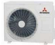
SRC25, 35, 45-ZMP